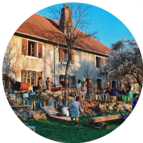
Frédéric Le Thiec, conseiller de l'habitat optimisé